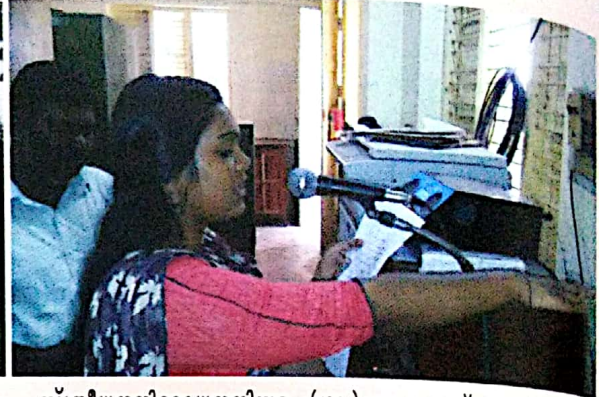
സ്ത്രീധനനിരോധനനിരോധനം (1961) ബോധവൽക്കരണ പരിപാടി