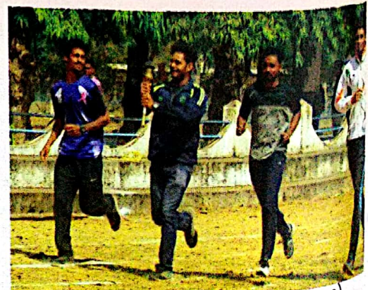
വാർഷിക കായികമേള (2017-18)