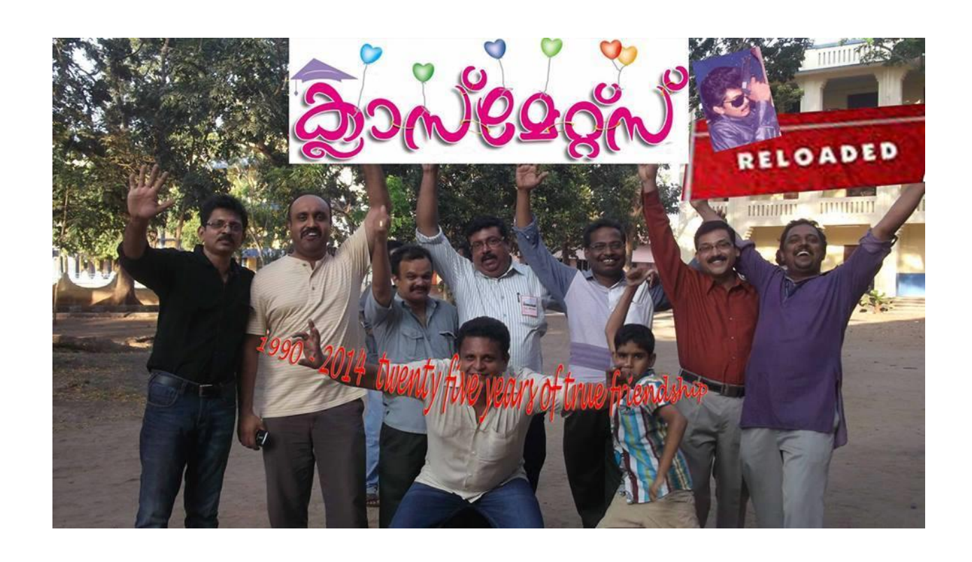
The association has overseas chapters maintaining stron bond with the Alma Mater.