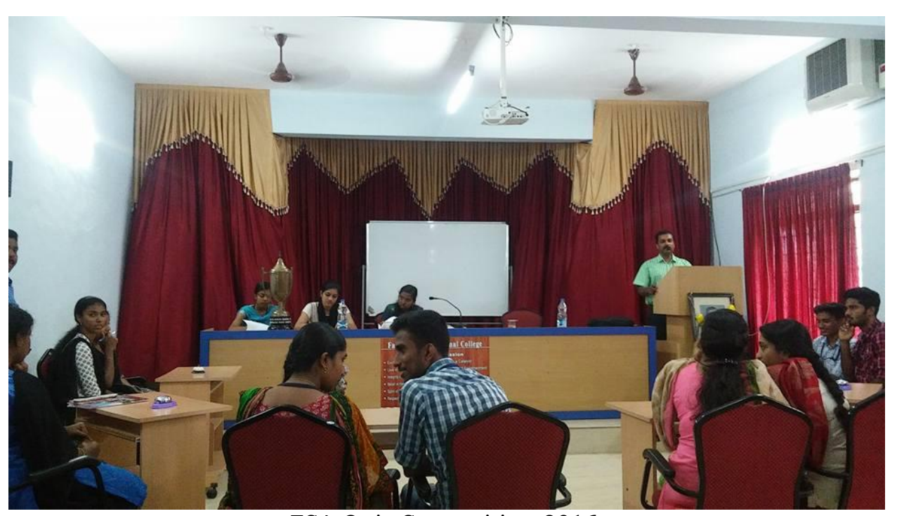
FSA Quiz Competition-2016