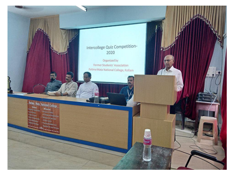
Inter-collegiate Quiz Competition organized by FSA

Apart from extending financial aid to poor students, the Endowment also organize special lectures/seminars on topics useful to students academically.